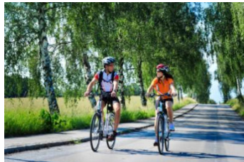
Freizeit und Tourismus