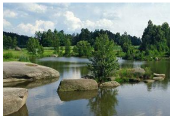
Natur und Erholung