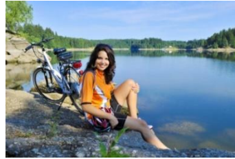
Wohn- und Lebensqualität